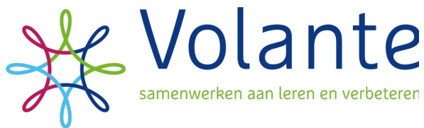
Figuur 2. Oud logo

besloten het logo en de slogan van Volante aan te passen. Vollandis vond met name het wielletje erg lijken op hun symbool. Wij hebben aangeboden om dit te veranderen in een andere vorm maar wel met behoud van onze kleuren. Daarnaast hebben we aangeboden om 'GGZ' toe te voegen in de ondertitel. Samen werken aan leren en verbeteren wordt dan: Samen werken aan leren en verbeteren in de GGZ. Dat is voor Vollandis voldoende om risico op verwarring te voorkomen. Er is een aantal alternatieve logo's ontworpen en de stuurgroep heeft unaniem gekozen voor onderstaande. Alle communicatie uitingen (website, banners, social media etc) zijn hierop aangepast.